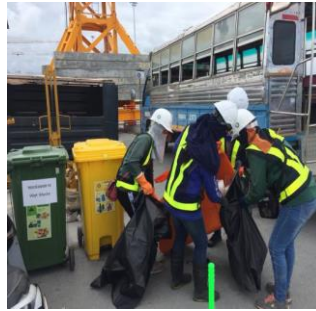
การเก็บขยะในพื้นที่ก่อสร้าง