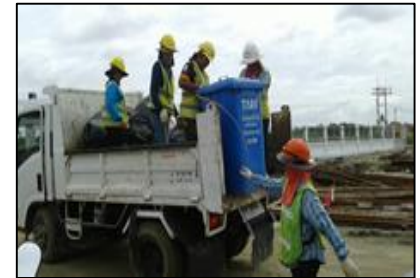
กิจกรรม 5 ส.