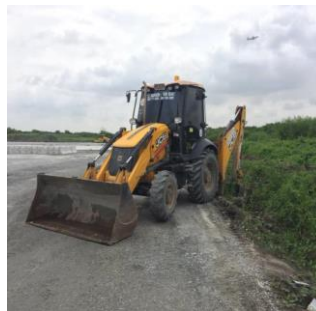
ขุดลอกทางระบายน้ำ