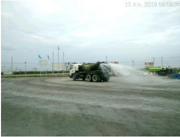
ฉีดพรมน้ำในพื้นที่ ก่อสร้าง