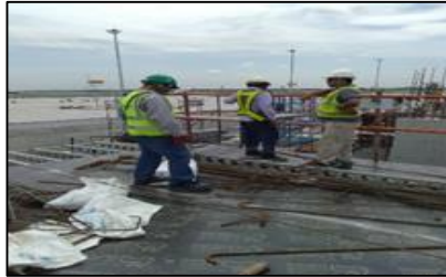
อบรมพนักงานใหม่