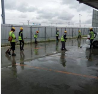
การทำความสะอาดถนนในบริเวณพื้นที่ก่อสร้าง