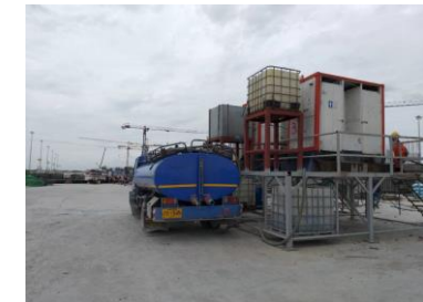
สูบล้างปฏิภาณบริเวณหน้างาน