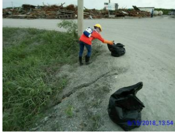
การเก็บขยะในรางระบาย น้ำ