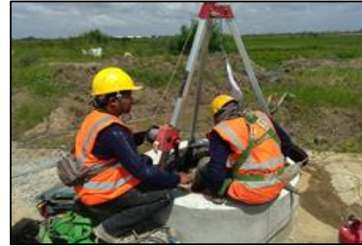
การทำงานในพื้นที่อัป อากาศ