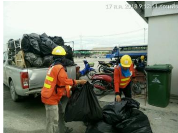
การเก็บขยะในพนัง ก่อสร้าง