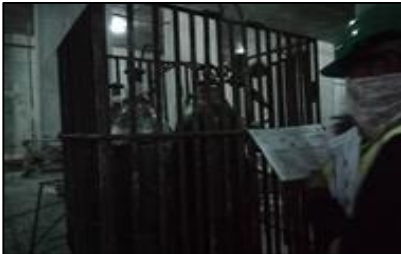
Check list การตรวจ เครื่องจักร