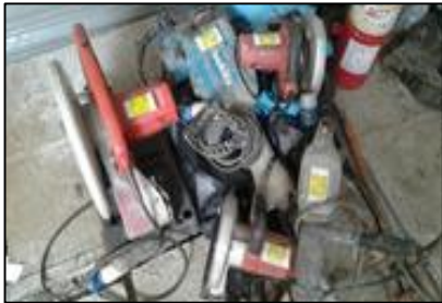
การตรวจอุปกรณ์/ เครื่องมือ