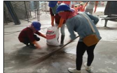
ประชุมความปลอดภัย