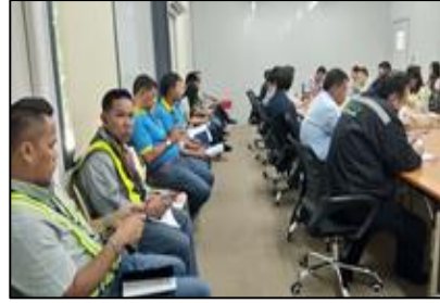
ประชุมความปลอดภัยฯ