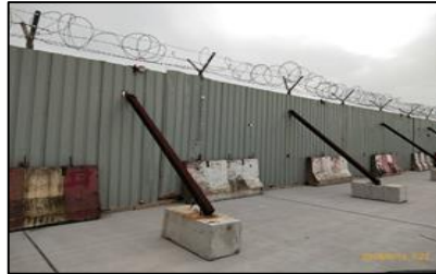
ตรวจพนักงานก่อนเข้าอุโมงค์