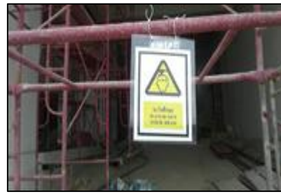
เพิ่มเติมป้ายเตือน/ป้าย บังคับ