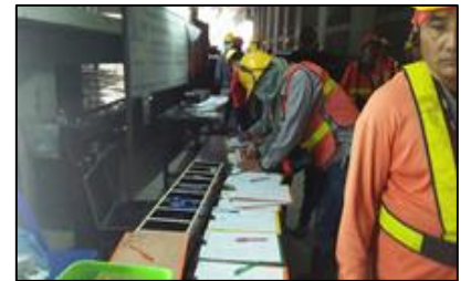
กิจกรรม 5 ส.