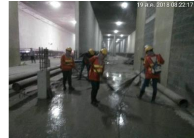
การทำความสะอาด อุโมงค์