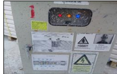
ตรวจตู้ไฟฟ้า