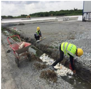
การเก็บขยะในทางระบายน้ำ