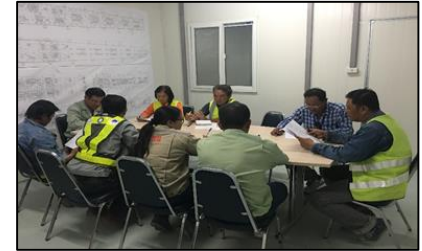
ตรวจความปลอดภัยพื้นที่หน้างาน