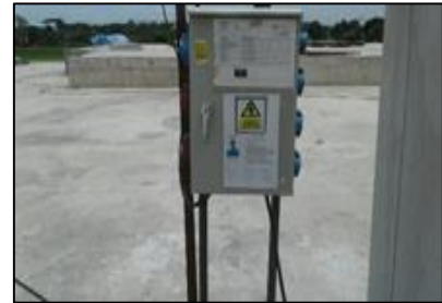
กั้นพื้นที่ต่างระดับ