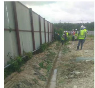
กำจัดวัชพืชในทางระบายน้ำ