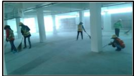
กิจกรรม 5 ส