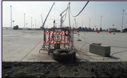
จุดตรวจวัดบริเวณพื้นที่ก่อสร้าง ITD