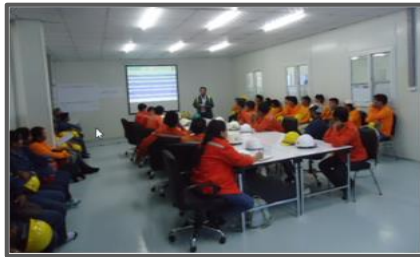
ห้องอบรม