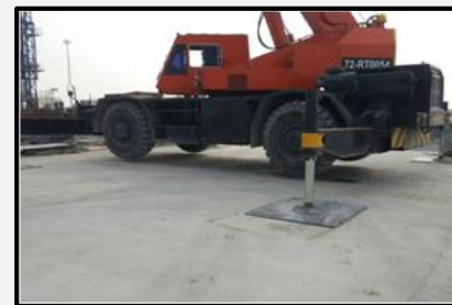
หลังแก้ไข จัดให้มีแผ่นรองขาเครน