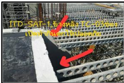
ก่อนแก้ไข ให้จัดทำราวกันตก