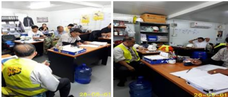
Audit ที่ทีมงาน Sat-1 สัญญา CC1.1