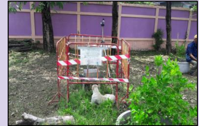
จุดตรวจวัดบริเวณโรงเรียนวัดกิ่งแก้ว