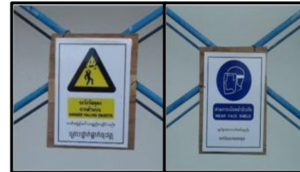
เพิ่มเติมป้ายความปลอดภัย