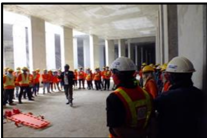
อบรมการทำงานในที่อับอากาศ