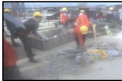
กิจกรรม 5 ส