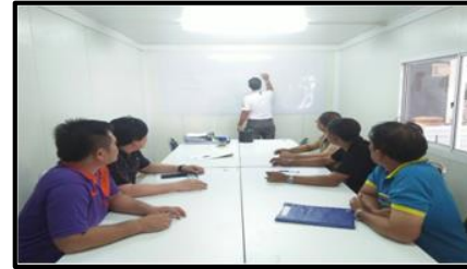
ประชุม คปอ.