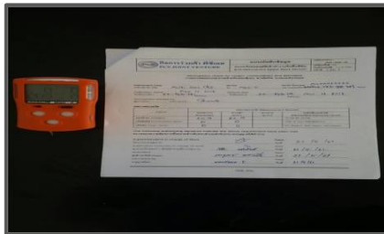
ตรวจวัดสภาพอากาศ