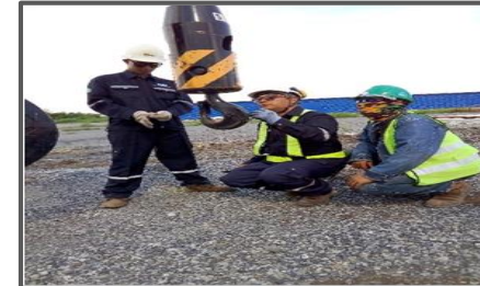
ตรวจเช็คอุปกรณ์การยก