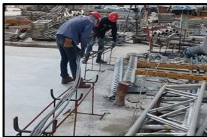
ป้องกันสายไฟฟ้าแช่น้ำ