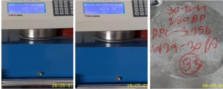
ทดสอบแท่นตัวอย่าง PQC สัญญา CC1.1