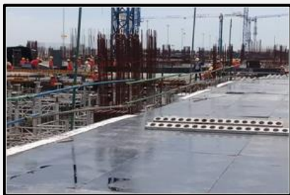
หลังแก้ไข จัดทำราวกันตก