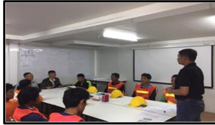
อบรมพนักงานใหม่