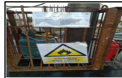
ตรวจเช็คถังลมถังแก๊ส