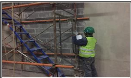
ตรวจสอบนั่งร้าน