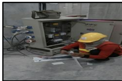
ตรวจเช็คตู้ไฟฟ้า