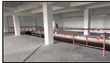
กันพื้นที่ต่างระดับ