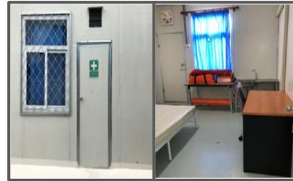
ห้องพยาบาล