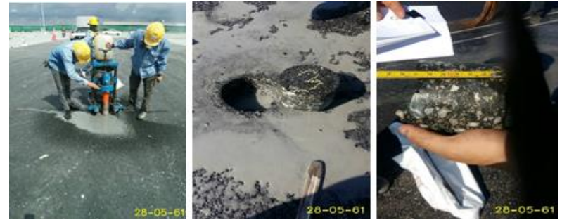
ตรวจเช็คความหนาแอสฟัลท์ติก สัญญา CC1.1