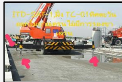
ก่อนแก้ไข ให้มีแผ่นรองขาเครน