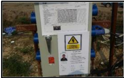
ตรวจเช็คตู้ไฟฟ้า