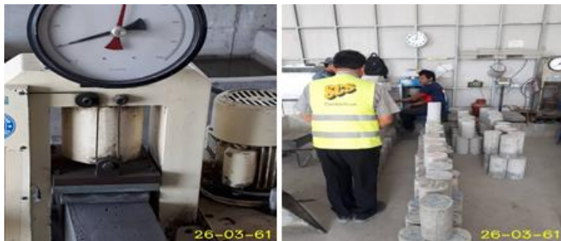
ทดสอบแท่นตัวอย่างคอนกรีต สัญญา CC1.1