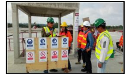
ป้ายเตือนความปลอดภัย