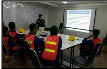
อบรมพนักงานใหม่