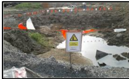
การกั้นพื้นที่ต่างระดับ