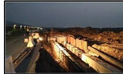
แสงสว่างในการทำงาน