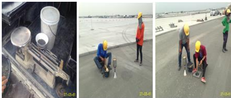
ทดสอบ CTB สัญญา CC1.1