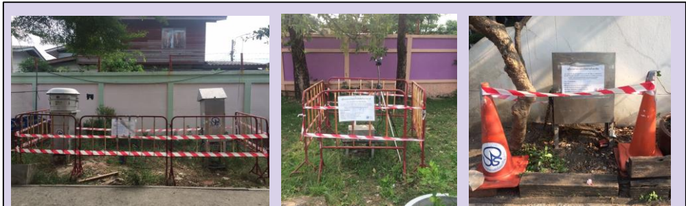
จุดตรวจวัดบริเวณโรงเรียนวัดกิ่งแก้ว