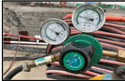
ตรวจเช็คควาล์วกันย้อน