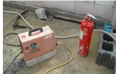
ตรวจเช็คอุปกรณ์เครื่องมือ