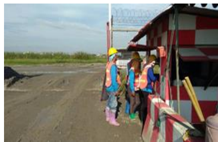
การตรวจก่อนเข้า Airside