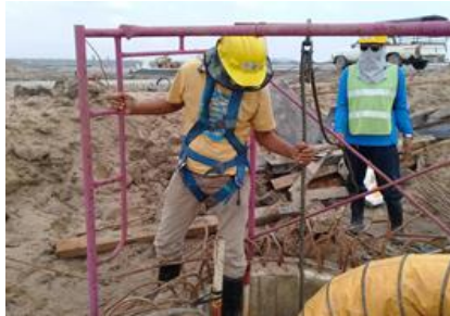
การป้องกันอันตรายจากที่สูง