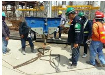
ตรวจสอบอุปกรณ์การยก