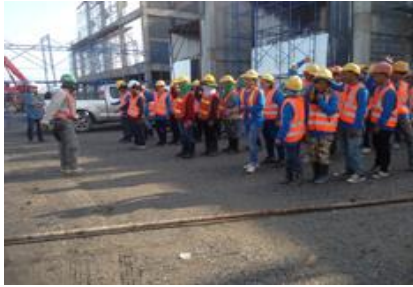
กิจกรรม Safety Talk