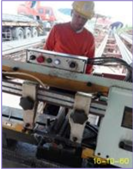
ตัดเหล็ก CC1.1