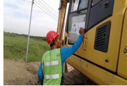
ตรวจสอบเครื่องจักร