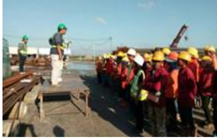
กิจกรรม Safety Talk