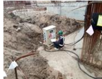
ตรวจตู้ไฟ