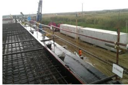
ราวกันตกในพื้นที่ต่ำระดับ