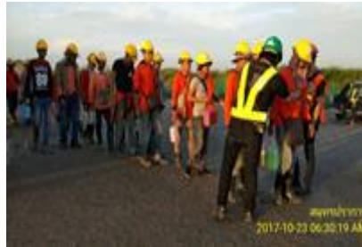
ตรวจบัตรพนักงาน