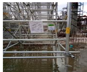
การตรวจสอบนั่งร้าน