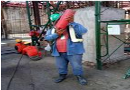
ตรวจถังดับเพลิง