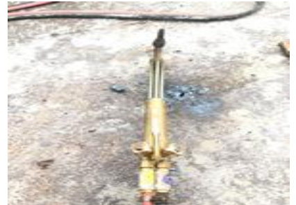
การตรวจสอบชุดตัดแก๊ส 4