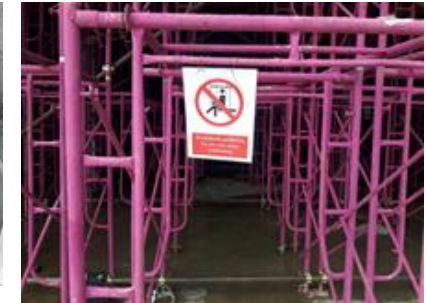
ป้ายเตือนในงานเสี่ยง